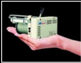
輕薄短小 Compact Size